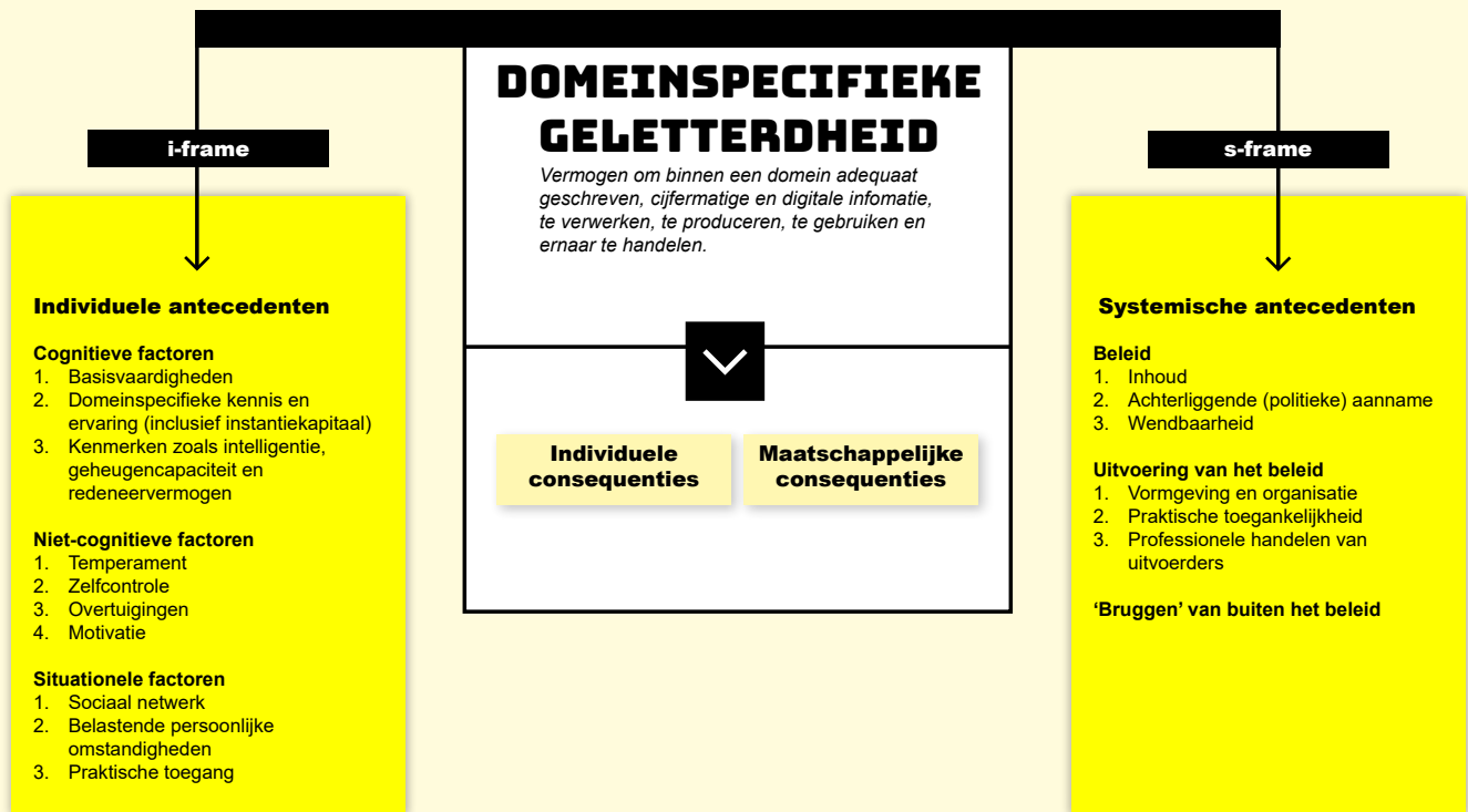
Figuur 1: Nieuw model voor domeinspecifieke geletterdheid